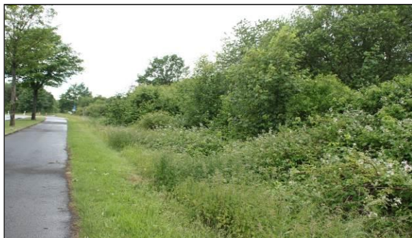
Abb. 10: Straßenbegleitgrün mit angrenzendem Gehölzsaum im Süden des Plangebietes