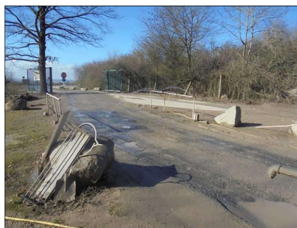
Abb. 4: Ausfahrt vom Gelände der Recyclingbauschuttanlage, Blick nach Süden.