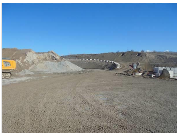
Abb. 5: Gelände der Recyclinganlage, Blick nach Norden.

Das Plangebiet ist vor allem durch die großflächigen Bereiche mit Gesteinsaufschüttungen verschiedener Korngrößen ohne jeglichen pflanzlichen Bewuchs geprägt. Das Betriebsgelände befindet sich bis zu 6 m unterhalb seiner Umgebung, wodurch sich die Bauschutt aufschüttungen auf verschiedenen Ebenen befinden (Abb. 5, Abb. 6). Im Süden liegt die Ein- und Ausfahrt des Geländes mit Waage, Bürogebäuden und Reifenwaschanlage (Abb. 3, Abb. 4). Zusätzlich steht dort ein circa 1920 erbautes, jedoch baufälliges Gebäude.