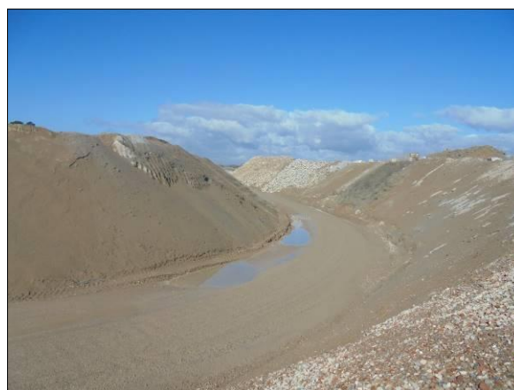
Abb. 6: Gelände der Recyclinganlage, Blick nach Westen.