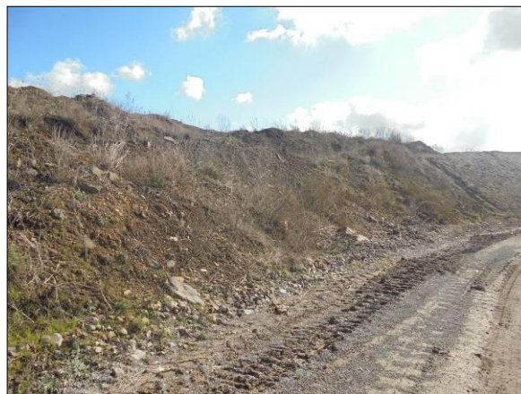
Abb. 9: Ruderal überwachener Hangbereich, Blick nach Nordosten.

Rund um die Recyclinganlage befindet sich ein dichter Gehölzsaum , der den Bereich der Recyclinganlage von außen uneinsehbar macht (Abb. 10, Abb. 11). Innerhalb des Laubgehölzsaumes finden sich immer wieder einzelne Obstbäume. Zu den hier vorhandenen Gehölzen inklusive krautigem Unterwuchs zählen die Arten: