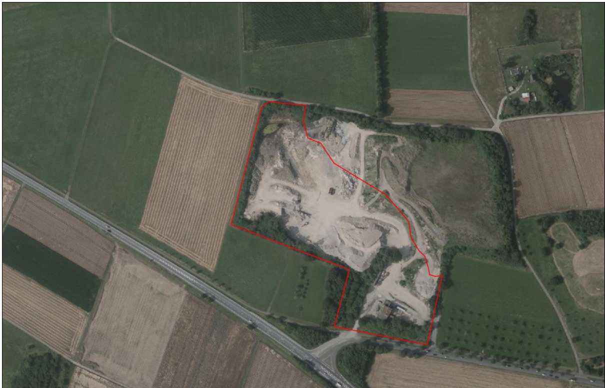
Abb. 1: Lage des Plangebietes (rote Umrandung) im Luftbild.