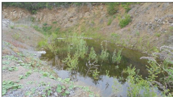
Abb. 7: Teich mit Steilwand im Hintergrund, Blick nach Nordwesten. Aufgenommen im Mai 2017.

Der Teich befindet sich im Nordwesten des Plangebietes (Abb. 7). Dieser ist nach Norden durch eine Steilwand von den Laubgebüschern getrennt. Durch eine Bestandserfassung der Fauna 2018 konnte unter anderem der gefährdete Kammolch (Anhang IV-Art FFH-Richtlinie) identifiziert werden.