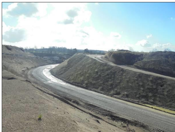
Abb. 8: Ruderal überwachener Hangbereich, Blick nach Osten.