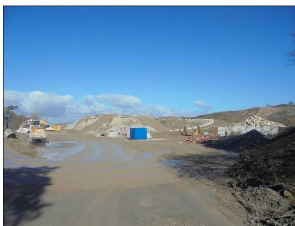
Abb. 3: Einfahrt auf das Gelände der Recyclingbauschuttanlage, Blick nach Westen.