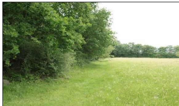
Abb. 11: Blick von Westen (außerhalb des Plangebietes) auf den die Recyclinganlage umgebenden Laubgehölzsaum.